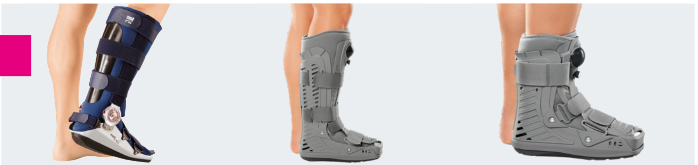
medi ROM Walker

Unterschenkel-Fußorthese zur Mobilisierung in einstellbaren Bewegungsumfängen